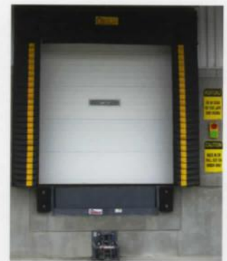
Systèmes de fermeture et de protection de Pentalift

Pentalift fabrique une gamme complète de systèmes de fermeture gonflables et en mousse ainsi que des systèmes de protection souples, rigides et gonflables. Tous les produits sont conçus pour améliorer la sûreté, protéger la marchandise, réduire les coûts d'énergie et améliorer la sécurité aux quais de chargement. La grande gamme de matériaux, de configurations et d'options vous permet de créer la meilleure solution pour votre application. Protégez votre produit et votre personnel!