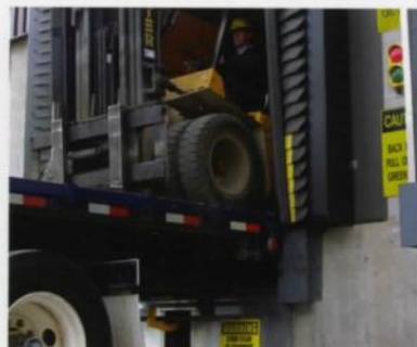
Système de retenue Ultrahook de Pentalift