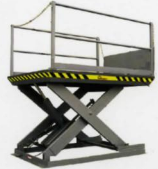
Tables élévatrices de Pentalift

Plus sécuritaire et plus efficace que le chargement par rampe ou à la main!