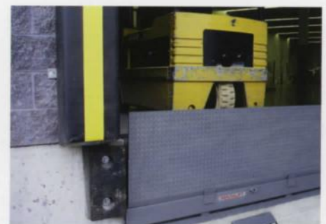
Système de prévention de roulement de bord de Pentalift