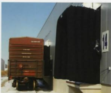
Abri gonflable pour voie ferrée de Pentalift