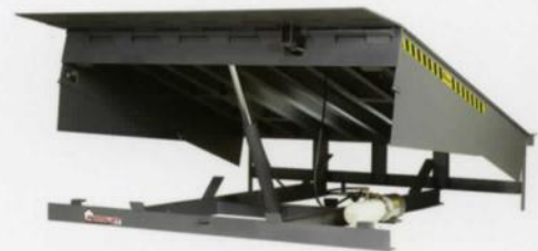
Systèmes hydrauliques de mise à niveau de Pentalift

Conçu pour offrir fiabilité, sécurité et rendement!