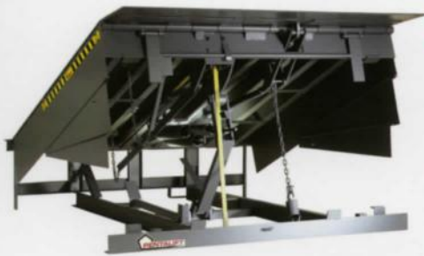
Systèmes mécaniques de mise à niveau de Pentalift