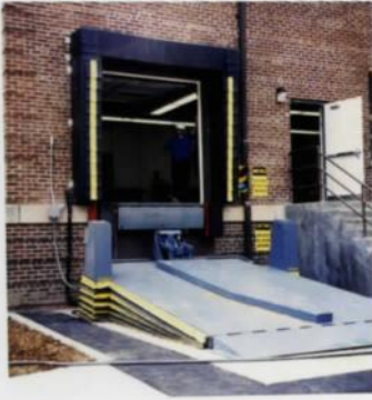
Systèmes de mise à niveau de camion de Pentalift