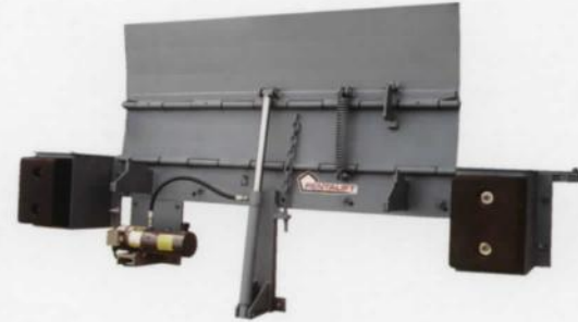
Systèmes de mise à niveau de bord de Pentalift

Facilement accessible de la surface du quai pour l'entretien!