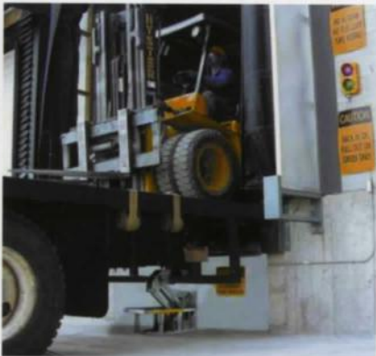
Systèmes hydrauliques de retenue de véhicule de Pentalift