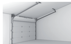
Pente de toit