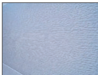
Grain de bois